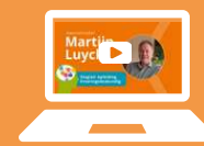
Kwartiermakers in beeld