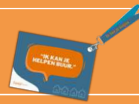
'Ik kan je helpen buur.'